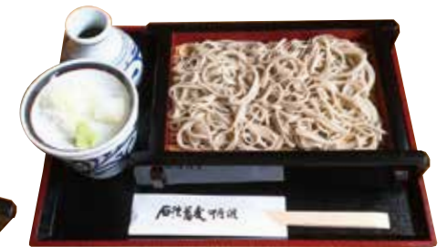
せいろそば 880円 大盛り 220円 追加せいろ 450円