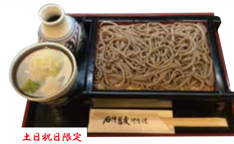
土日祝日限定 田舎せいろ 1000円