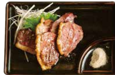
鴨ろ一寸焼 小 850円 1350円