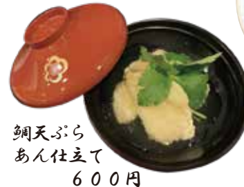
鯛天ぷら あん仕立て 600円